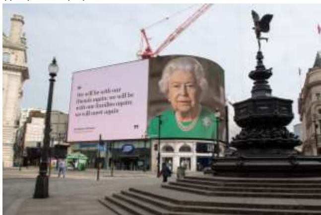
Μήνυμα από τη Βασίλισσά στην Piccadilly Circus.

Ο νέος κορωνοϊός επιβεβαιώθηκε για πρώτη φορά στο Ηνωμένο Βασίλειο στα τέλη Ιανουαρίου, αλλά ο αριθμός των καθημερινών επιβεβαιωμένων περιπτώσεων και των σχετικών θανάτων άρχισε να αυξάνεται σημαντικά στα μέσα Μαρτίου. Αν και τα αυστηρά μέτρα κοινωνικής απόστασης που θεσπίστηκαν στα τέλη Μαρτίου έχουν συμβάλει στη μείωση του ημερήσιου αριθμού θανάτων, το Ηνωμένο Βασίλειο έχει τώρα τον υψηλότερο επίσημο αριθμό θανάτων στην Ευρώπη και το δεύτερο υψηλότερο στον κόσμο. Οι περιορισμοί στην Αγγλία μειώθηκαν πρόσφατα (λιγότερο στη Σκωτία, την Ουαλία και τη Βόρεια Ιρλανδία), αλλά πολλές επιχειρήσεις και γραφεία παραμένουν κλειστά.