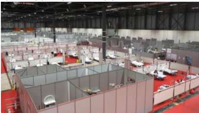
Το νοσοκομείο που στήθηκε στο Ifema, εκθεσιακό κέντρο της Μαδρίτης.

Η πρώτη ενεργή υπόθεση COVID-19 στην Ισπανία επιβεβαιώθηκε στις 31 Ιανουαρίου 2020. Η ισπανική κυβέρνηση κήρυξε κατάσταση έκτακτης ανάγκης στις 14 Μαρτίου, εκδίδοντας εθνική εντολή περιορισμού. Τα μη απαραίτητα καταστήματα, τα σχολεία, τα ξενοδοχεία και τα τουριστικά καταλύματα διατάχθηκαν να κλείσουν εντελώς για δύο εβδομάδες, και στη συνέχεια επετράπη στους εργαζόμενους στον τομέα των κατασκευών και της μεταποίησης να επιστρέψουν στην εργασία τους, αν και επεκτάθηκαν άλλοι περιορισμοί για τους υπόλοιπους πολίτες. Η Ισπανία έκλεισε επίσης τα εξωτερικά της σύνορα με τους ευρωπαϊούς γείτονές της. Οι επαγγελματίες του ιατρικού τομέα και όσοι ζουν σε γηροκομεία έχουν βιώσει ιδιαίτερα υψηλά ποσοστά μόλυνσης. Στις 25 Μαρτίου, ο αριθμός των νεκρών στην Ισπανία ξεπέρασε τον αριθμό της ηπειρωτικής Κίνας. Ο πραγματικός αριθμός περιπτώσεων και θανάτων πιστεύεται ότι είναι υποτιμημένος λόγω έλλειψης δοκιμών και αναφορών.